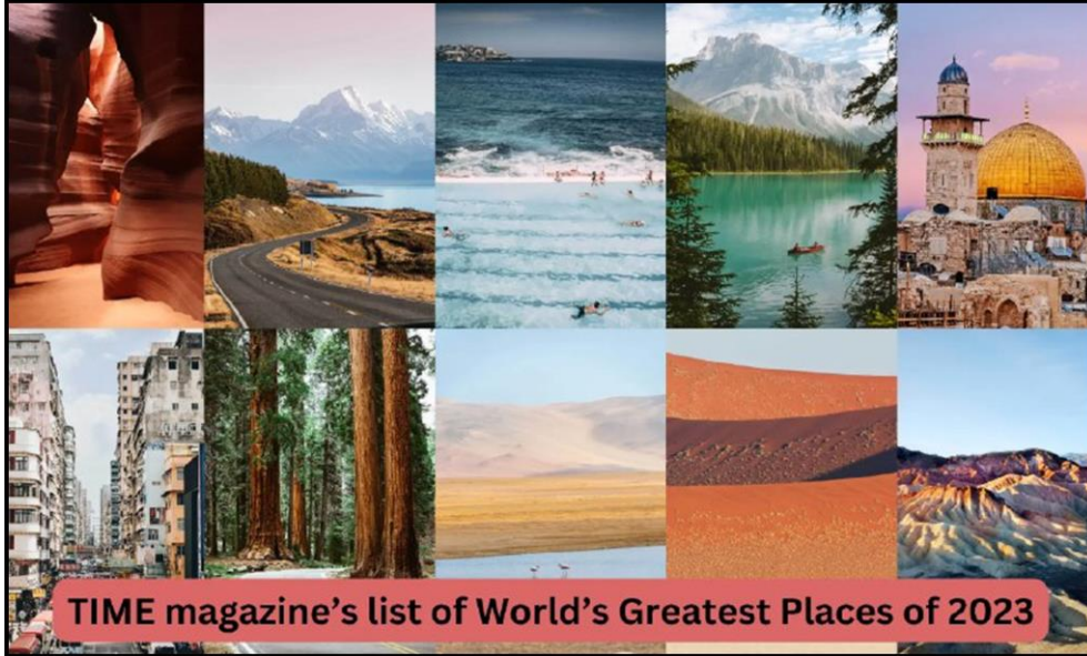
TIME magazine's list of World's Greatest Places of 2023

Which two Indian places have been included in Timeline's list of the world's greatest places of 2023?