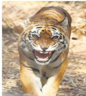
Steady rise: A tiger at Van Vihar National Park in Bhopal on Sunday.