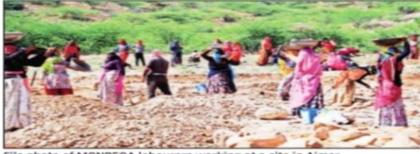
File photo of MGNREGA labourers working at a site in Ajmer

Rajasthan stood third in the country in terms of number of households completing 100 days of work. As many as 4,47,558 families completed 100 days of work under MGNREGA. Uttar Pradesh topped the country with 4,99,947 families completing 100 days of work, followed by Kerala with 4,48,913 families. Rajasthan generated 42.42