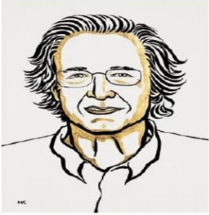
Ill. Niklas Elmehed © Nobel Prize Outreach Pierre Agostini Prize share: 1/3