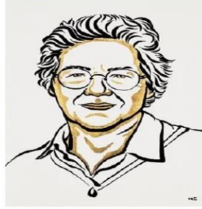
Anne L'Huillier Prize share: 1/3