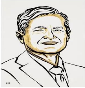
Ill. Niklas Elmehed © Nobel Prize Outreach Ferenc Krausz Prize share: 1/3