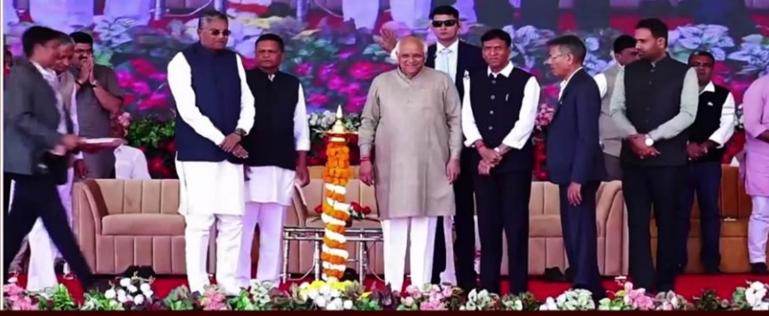
Union Minister Mansukh Mandaviya, Gujarat CM Bhupendra Patel lay foundation stone of cancer hospital in Rajkot

In which state did the Union Health Minister recently lay the foundation stone of 'Khodaldham Trust Cancer' Hospital?